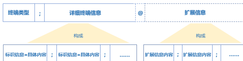
图 2 终端信息字符串结构图

终端信息字符串由终端类型、详细终端信息以及扩展信息三部分数据内容按一定顺序以一定格式拼接构成。其中扩展信息部分可根据具体情况确定是否需要，若不需要扩展信息，则终端信息字符串只包含终端类型和详细终端信息即可。如下图：