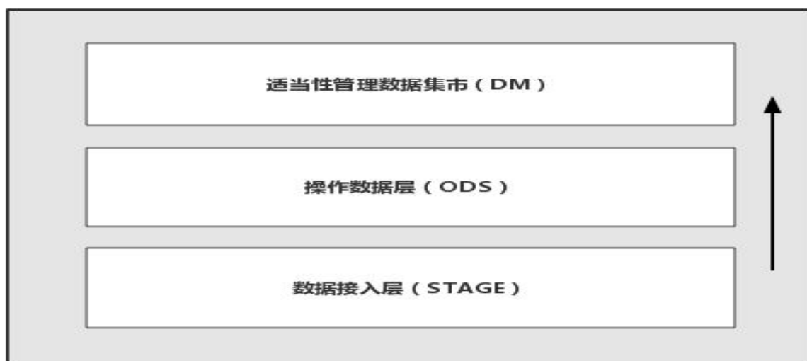
图 A.3 数据存储架构图