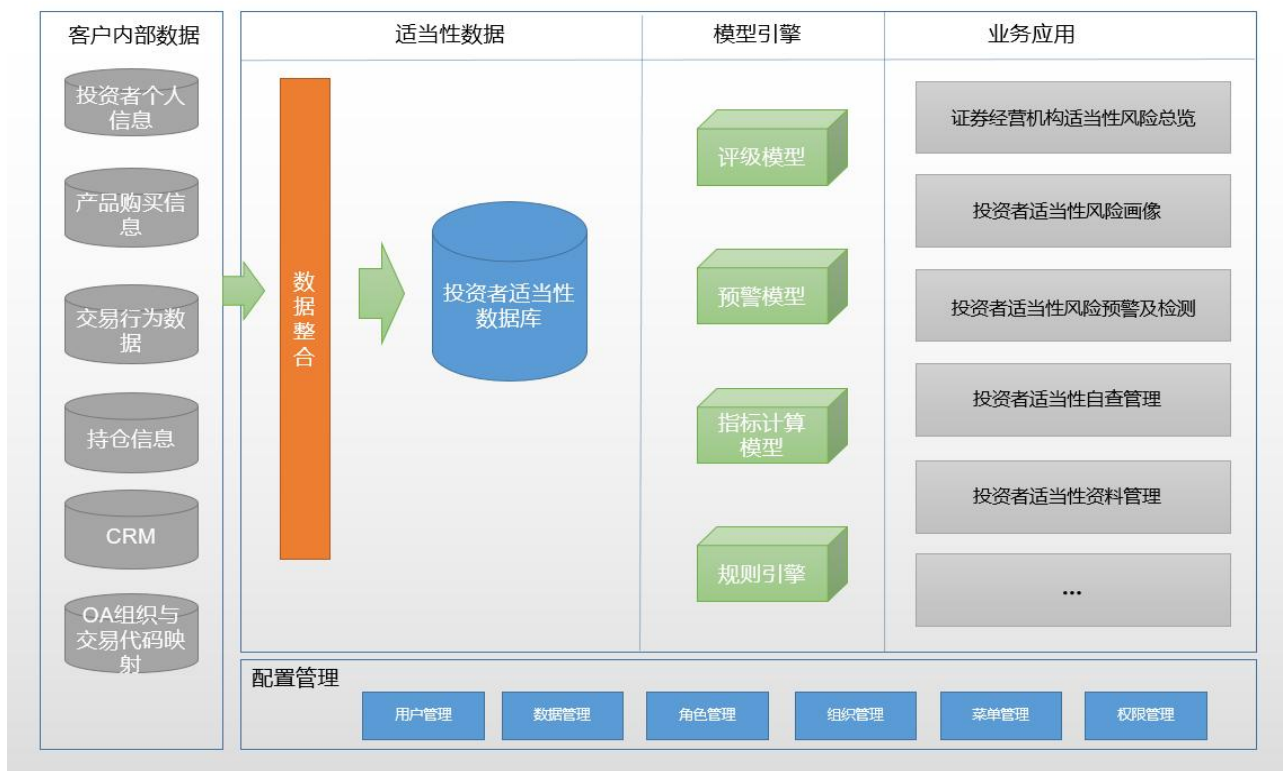
图 A.1 投资者适当性管理系统架构图